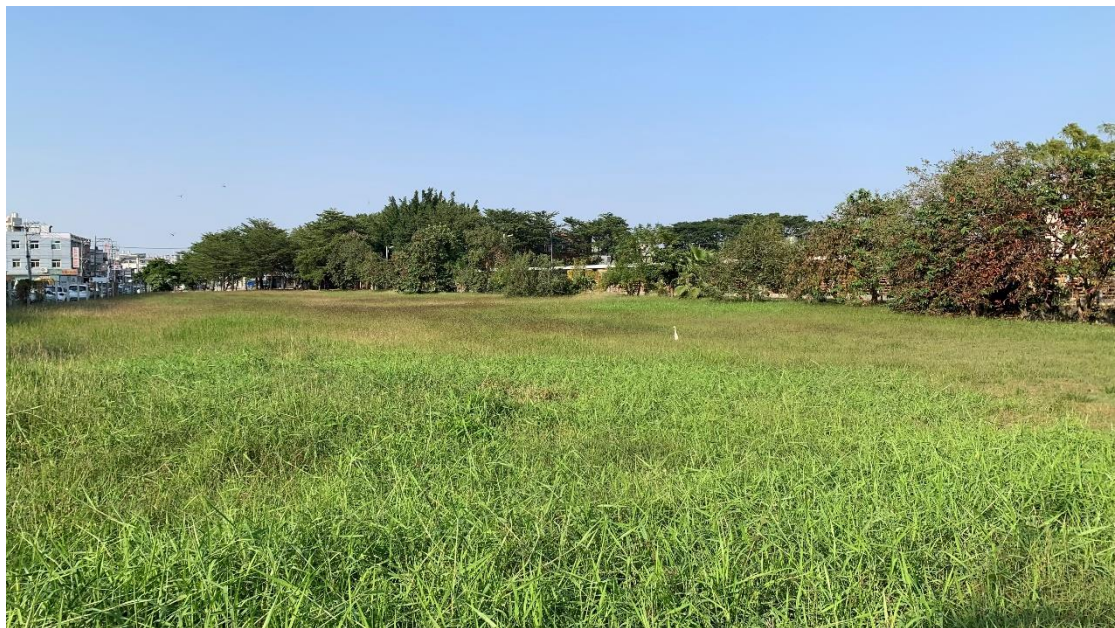
圖 2. 現場照片