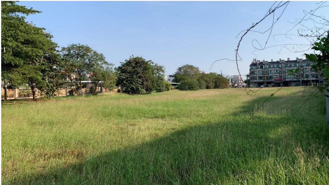
圖 4. 現場照片