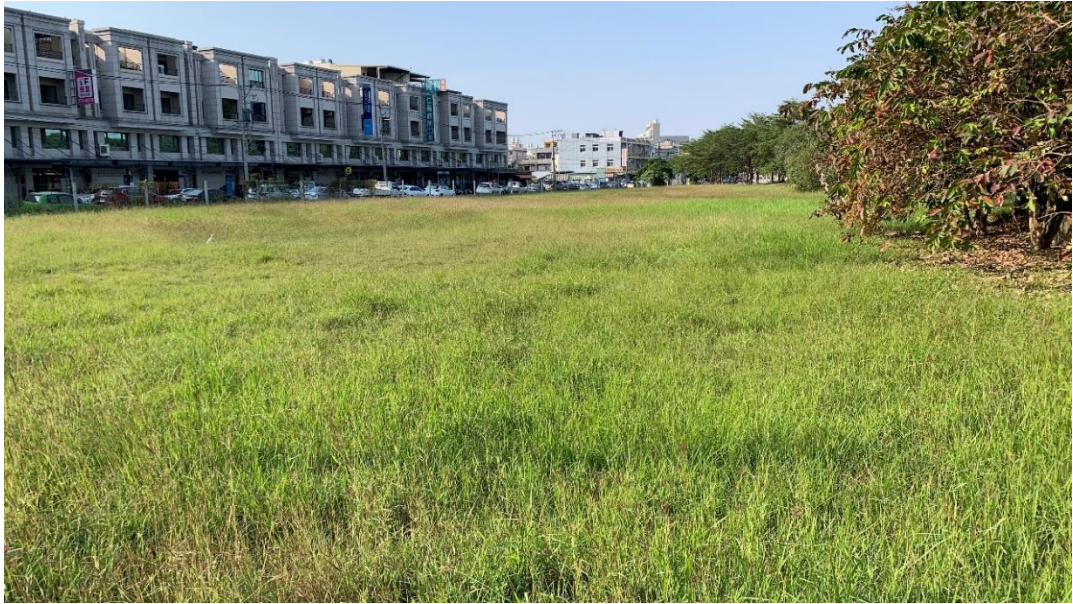
圖 3. 現場照片